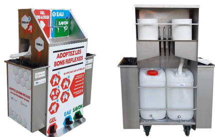
Structure robuste en acier inoxydable

Plus qu'indispensable dans les magasins, afin de s'assurer que les clients manipulent les marchandises dans de bonnes conditions et de se rassurer collectivement.